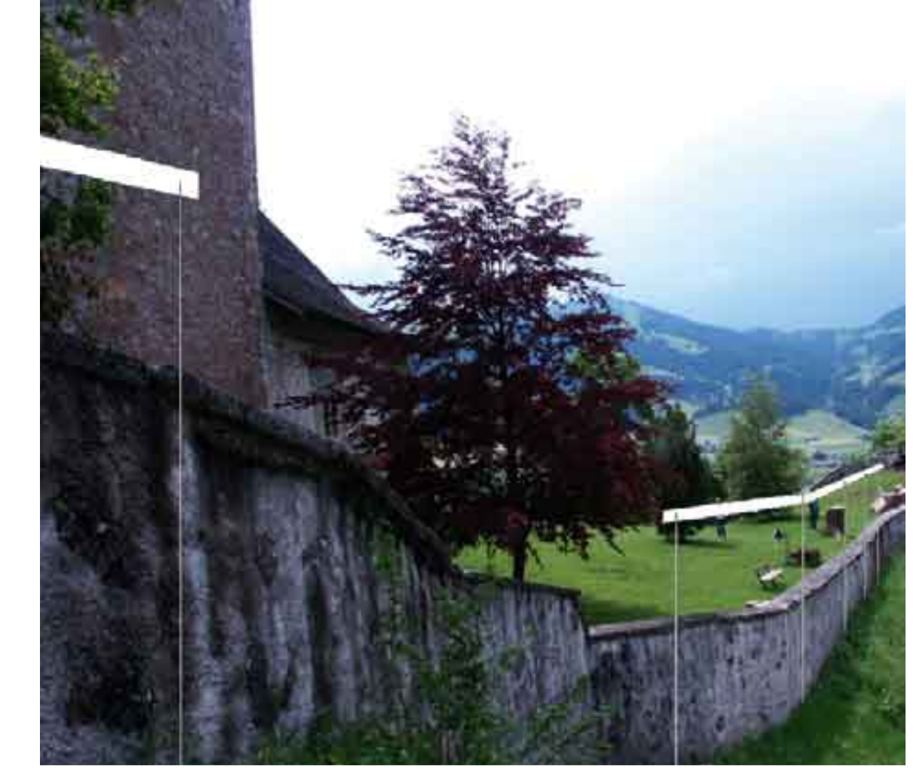
Création de lignes horizontales servant de repères et permettant de mieux comprendre la topographie du lieu. Ces lignes prennent la forme de lamelles en bois sur lesquelles les poèmes sont imprimés.