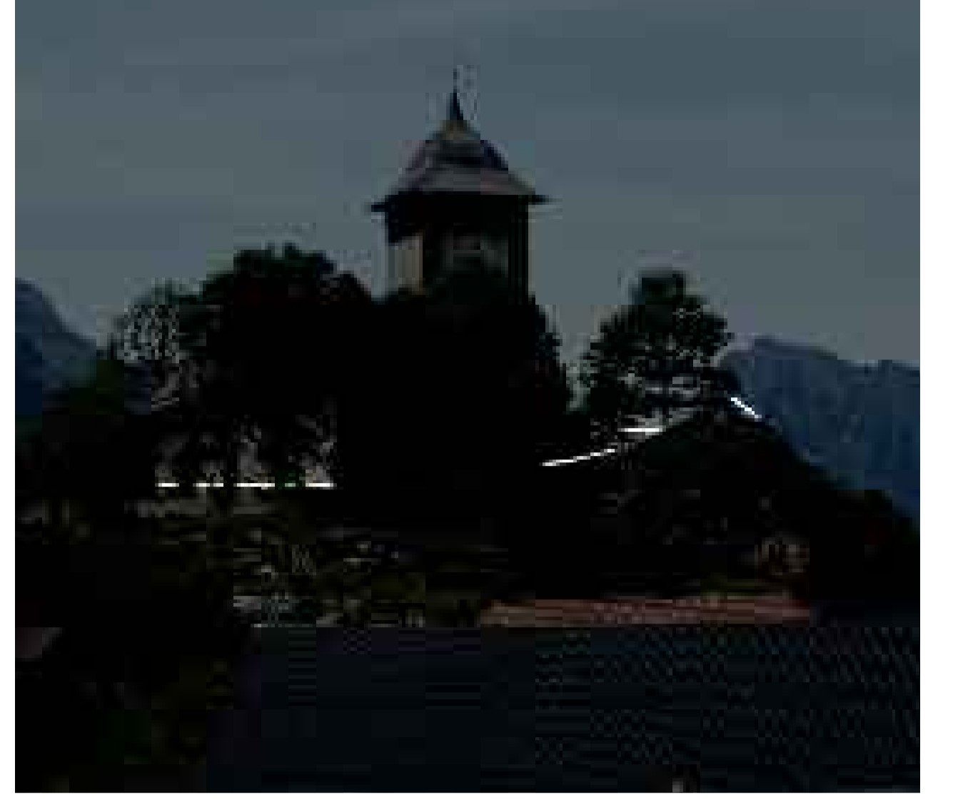
Les textes flotteront autour du temple. De nuit, cet effet sera encore renforcé par des bandes phosphorescentes au verso.